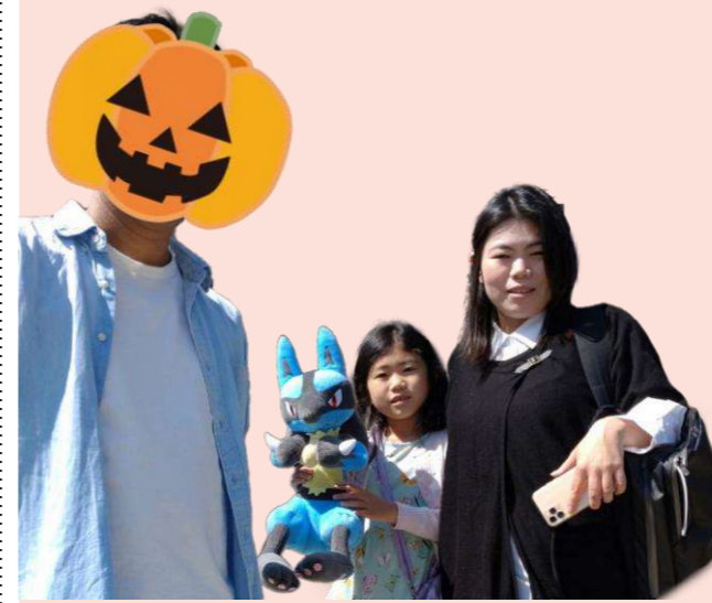
家族構成：3人家族（私+ふつうの夫+ポジっ娘）